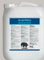
AmphiSilan LF koncentrát

Díky mikrostruktúře povrchové vrstvy srážková voda neproniká vrstvou nátěru a ve formě kapek odpadá z povrchu prach a další nečistoty.